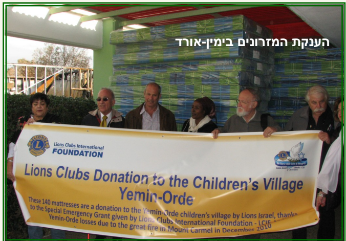
הענקת המזרונים בימין-אורד